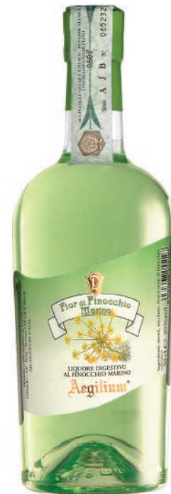
Fior di Finocchio Marino