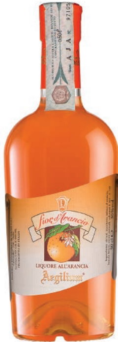
Fiori di Arancio