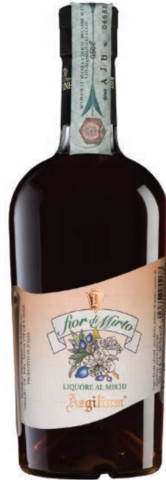
Fiori di Mirto