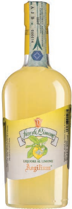
Fiori di Limone